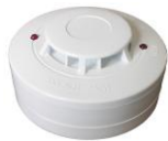
FDR-16-HR teplotní EN54-5

Detektory s výstupem relé určené jako doplněk EZS napájené 12V=