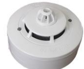
FDR-36-SHR teplotní - kouřový EN54-5,7