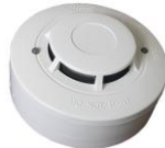
FDR-26-S/FDR-26B-S opticko kouřový EN54-7